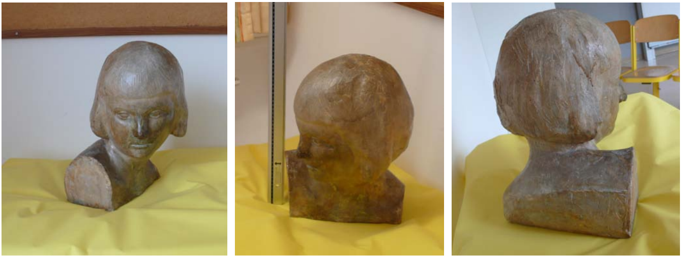
„ Mädchenkopf “, Ludwig Wittgenstein, um 1927; Terrakotta, bemalt (glasiert?); Höhe 39,5 cm, Breite 20 cm; im Besitz der Volksbank GHB Kärnten, Klagenfurt (2011).

Der wahrscheinlich im Atelier des Bildhauers Michael Drobil (1877-1958) entstandene „Mädchenkopf“ ist Wittgensteins einzig bekannte Arbeit als Bildhauer. Wittgenstein war seit der gemeinsamen Zeit in der italienischen Kriegsgefangenschaft (1918/19) mit Drobil befreundet. Der Kopf ist eine Modellierung aus Ton (Terrakotta), bemalt bzw. glasiert. Möglicherweise stellt er Marguerite Respinger (1904-2000) dar.